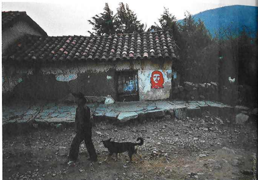
De autoriteiten van het dorp Vallegrande hopen in dit 'Che-jaar' op extra toeristen.