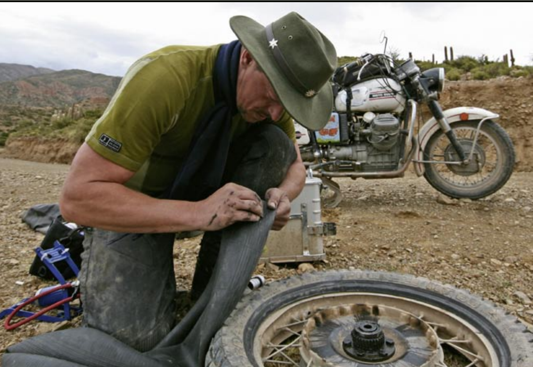
▲ Lekke band lappen, fluitje van een cent.

week mag de wereld de motor aanschouwen. Klein ritje en gauw weer naar huis. Klopje op de tank: 'Goed gedaan meisje.' De rest van de week warm aangekleed met een beschermhoes, want stel je voor dat ze verkouden wordt. Mijn 33-jarige V7 is een motorfiets, eentje met huevos, ballen. Ballen van staal. Althans, dat vind ik. Waarschijnlijk staat ze nu liever onder een stofdoek, prinsesserig te zijn. De weg – die is er niet. Het is een stijgend pad, bezaaid met grote keien. Ik loop naast de motor, anders komen we niet vooruit. Mijn maag knort van de honger. De koppeling van de motor kraakt van inspanning. De Guzzi zucht: 'Was ik maar een prinsesje.' Later zouden we hard ten val komen. Het spoor oogde vlak. De schakelde over naar de derde versnelling. De regen van de dagen ervoor had de weg in een biljartlaken veranderd. Voertuigen waren me nog niet voor geweest. Verraderlijk. Het voorwiel begon op het zompige oppervlak een eigen leven te leiden. De motor wierp de bestuurder uiteindelijk uit het zadel. Schade: ophanging van de linker zijkoffer afgebroken, evenals het laatste nog functionerende knipperlicht. Twintig kilometer verderop hetzelfde recept. Met dit verschil dat de